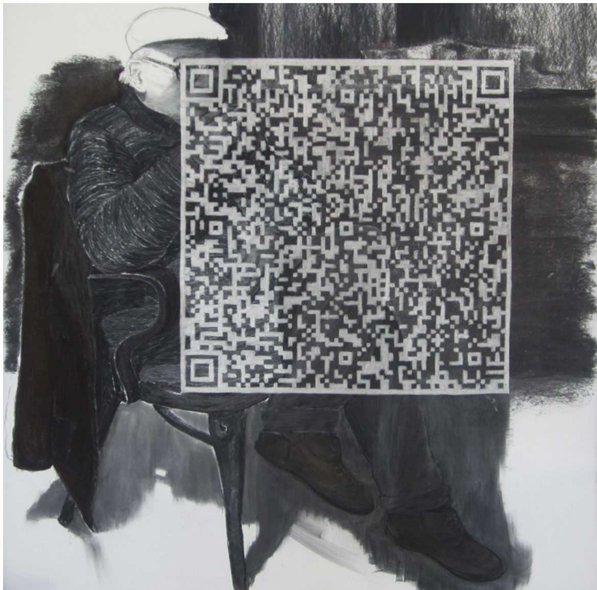
Bence György Pálinkás_ Scanning charcoal, paper 150 x 150 cm 2012