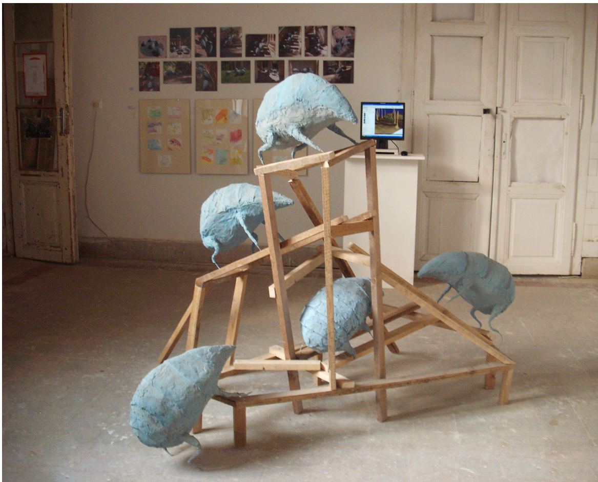
Tünde Horváth_ Ambling creatures installation, c-print 50 x 80 x 30 cm, 25 x 70 cm 2012