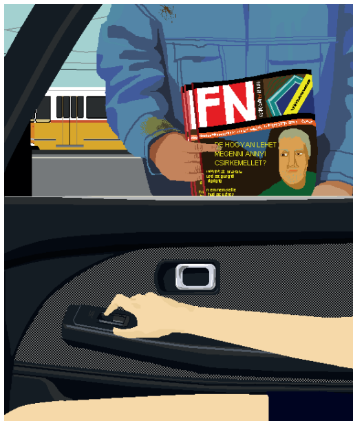
Noémi Mondik_ Paint ecstasy (The last subway, Koszorú street II., Homeless) GIF 2012