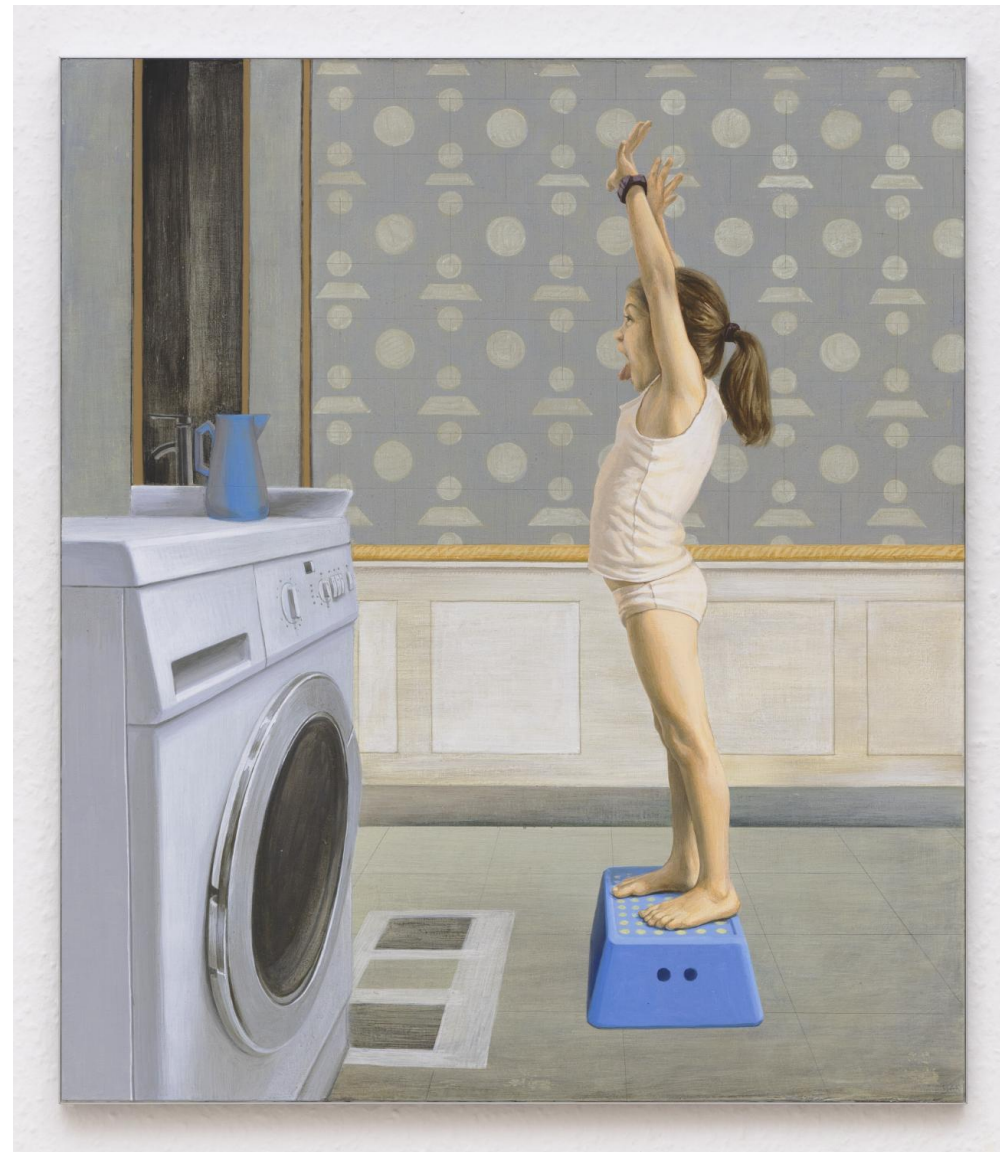
akril, farost, 75 x 65 cm