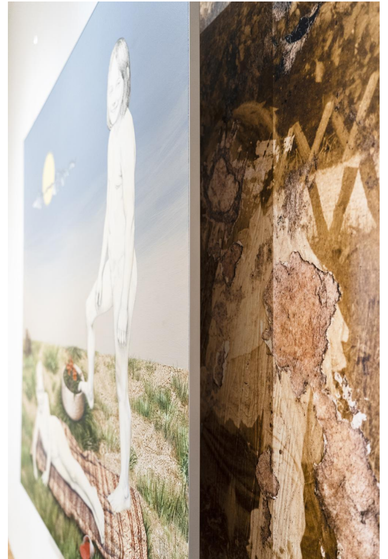
A kis fürdőzők, 2023