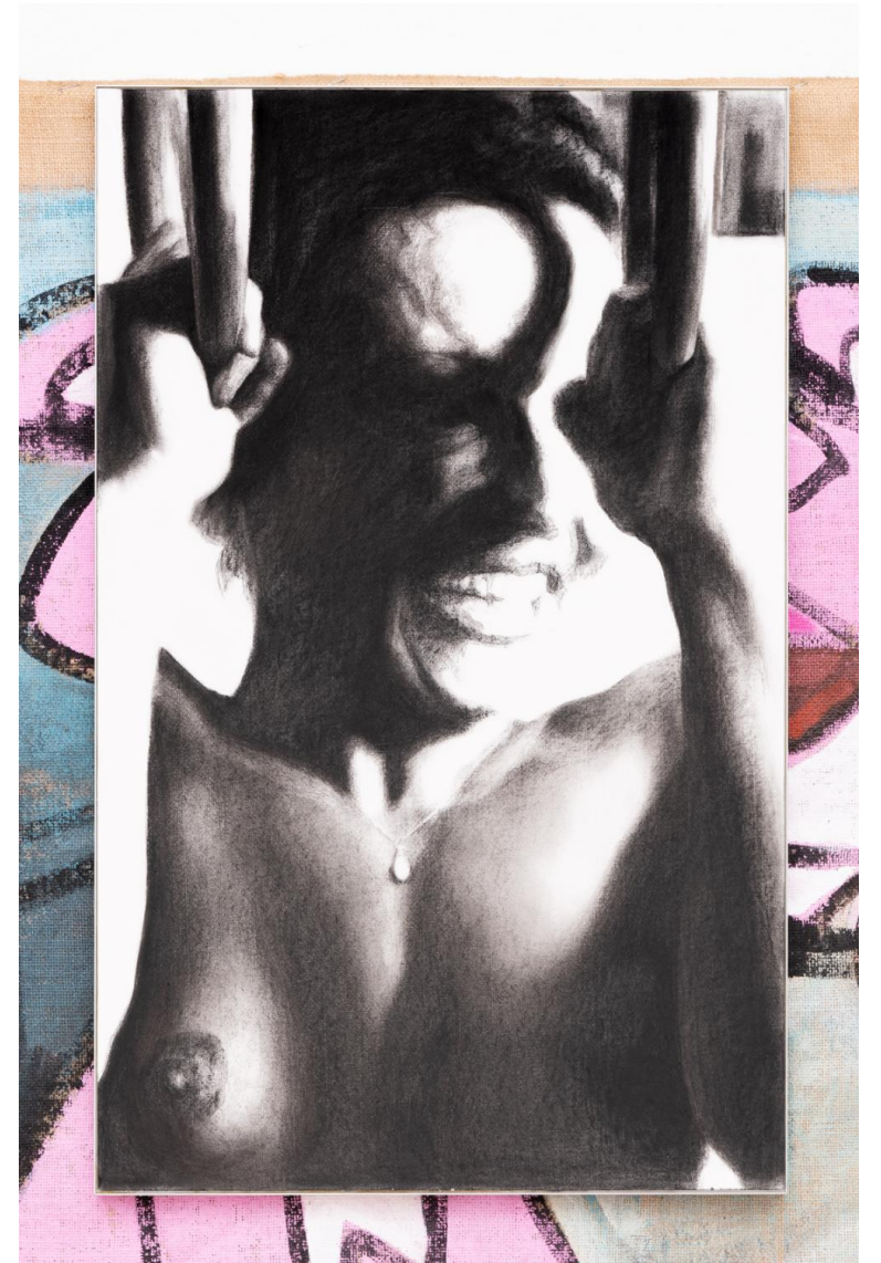
Első látásra rózsaszín, 2023