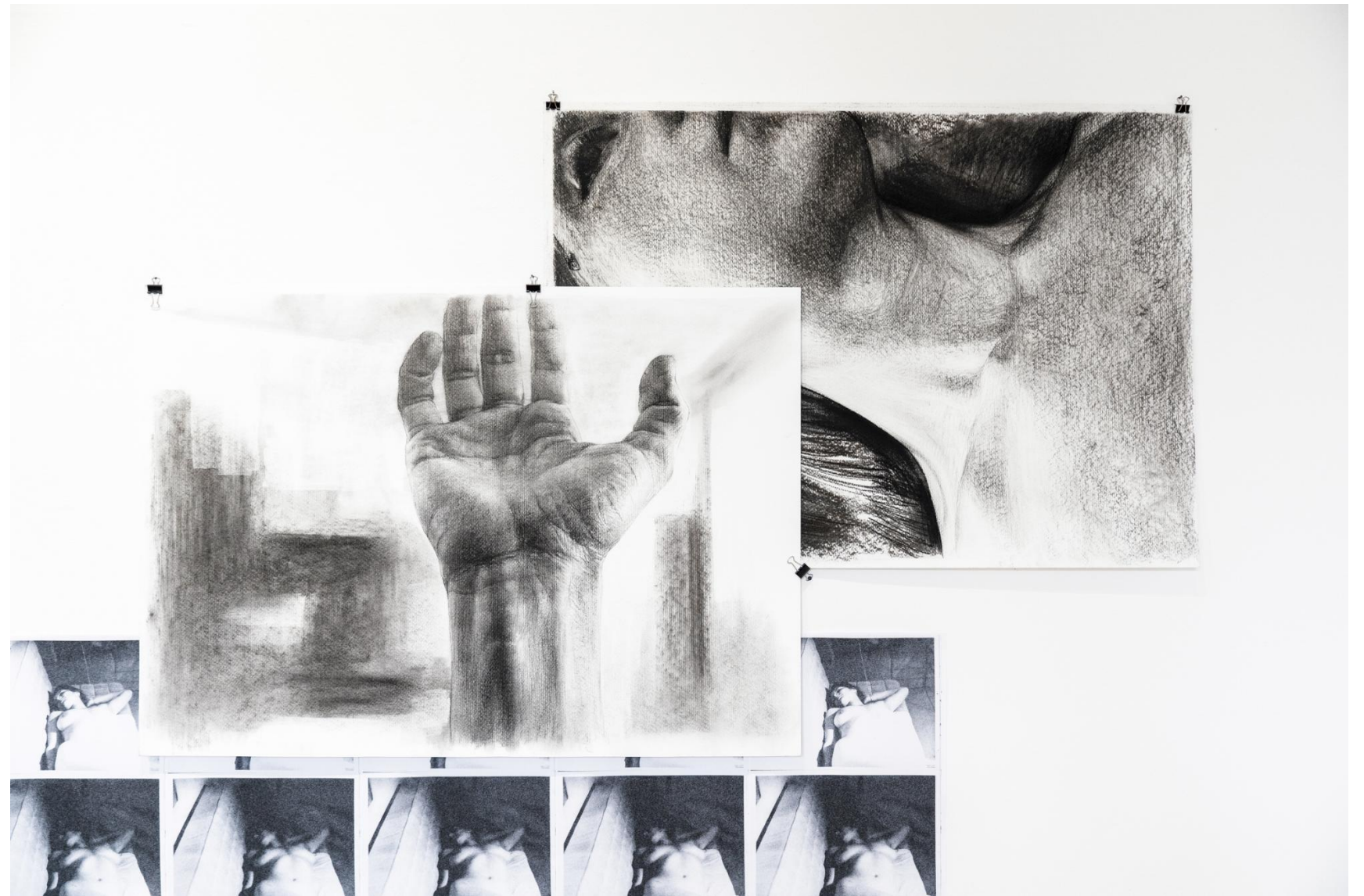
Kívül és belül, 2022 részlet