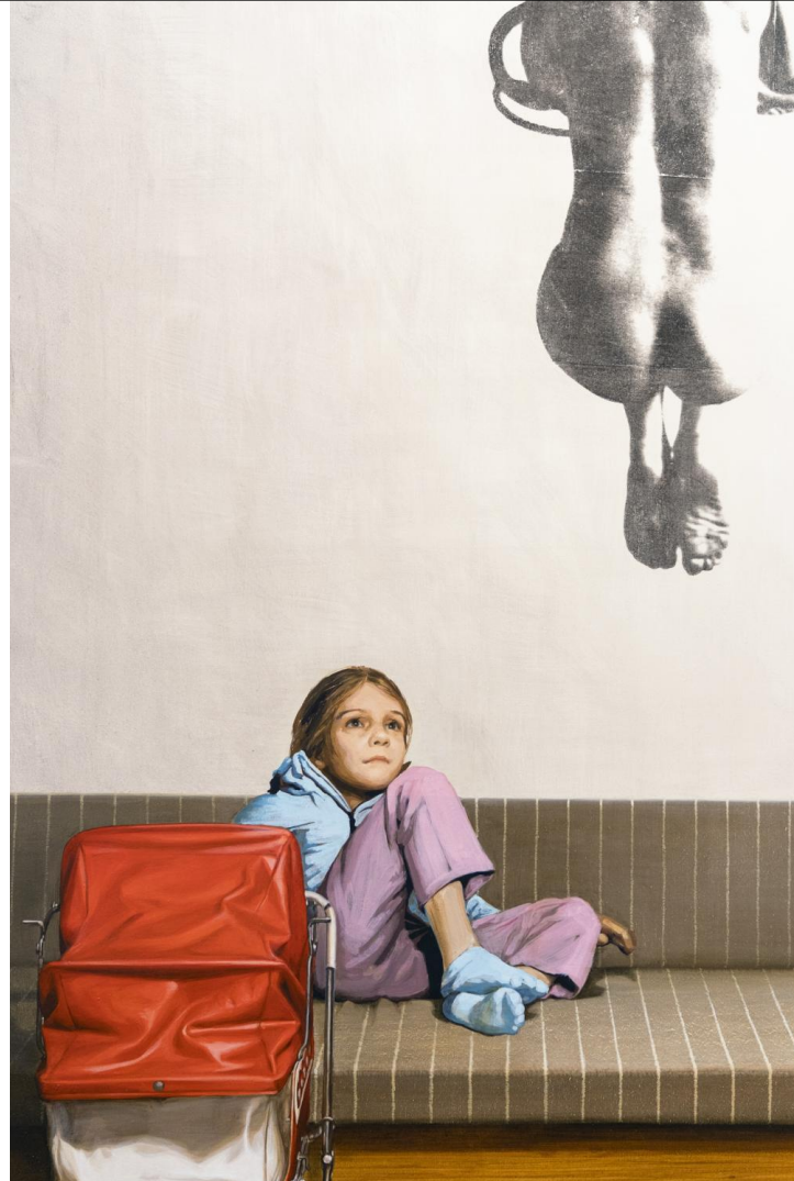
A hinta, 2023