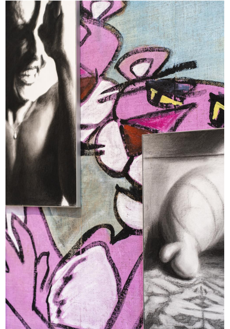
Első látásra rózsaszín, 2023