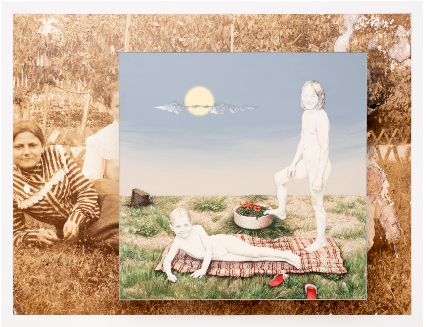
A kis fürdőzők, 2023 akril, farost, 140 x 140 cm és falmatrica 177 x 235 cm