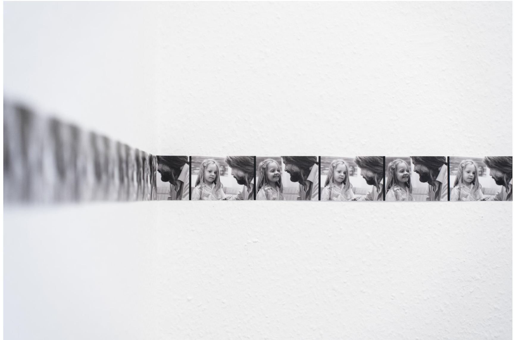
Megfelelni jó, 2023 installáció: digitális print ponyva szalagon (3 db), 8 x 138 cm