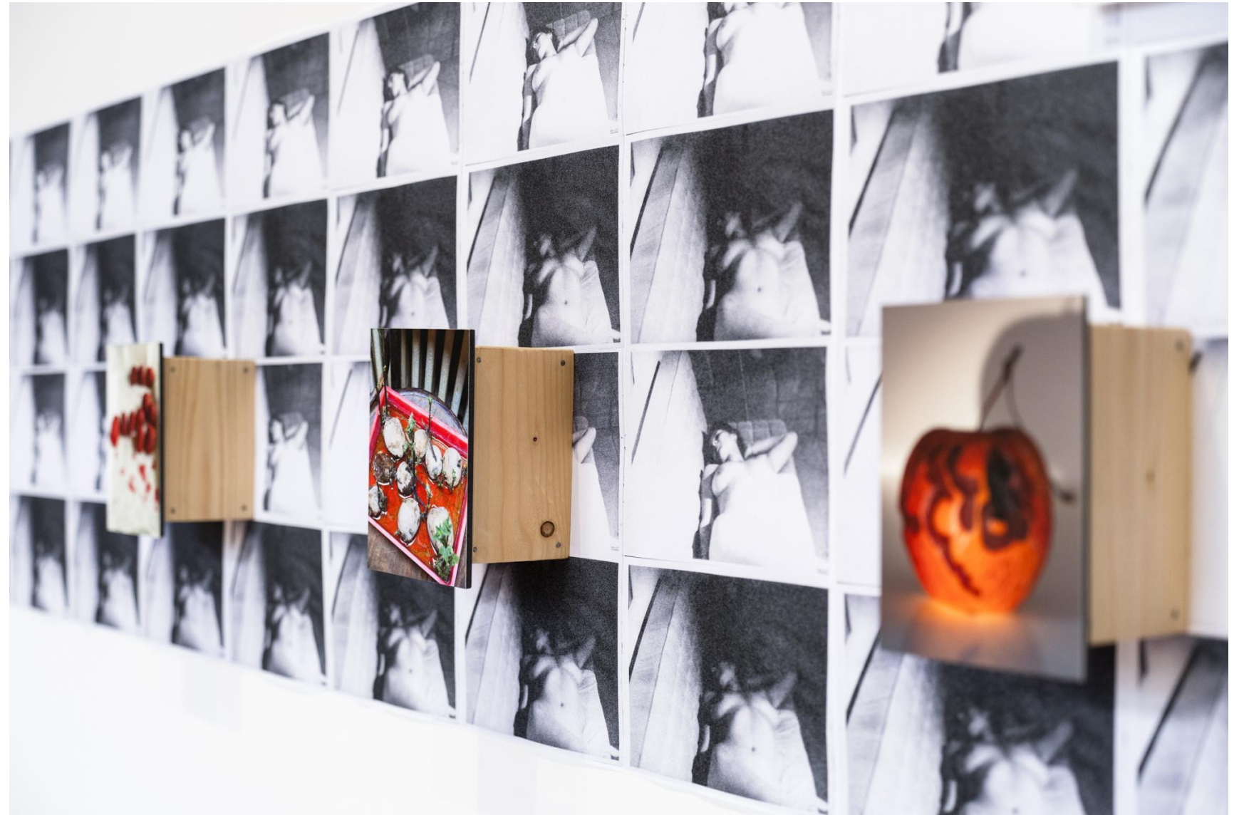
Kívül és belül, 2022 részlet