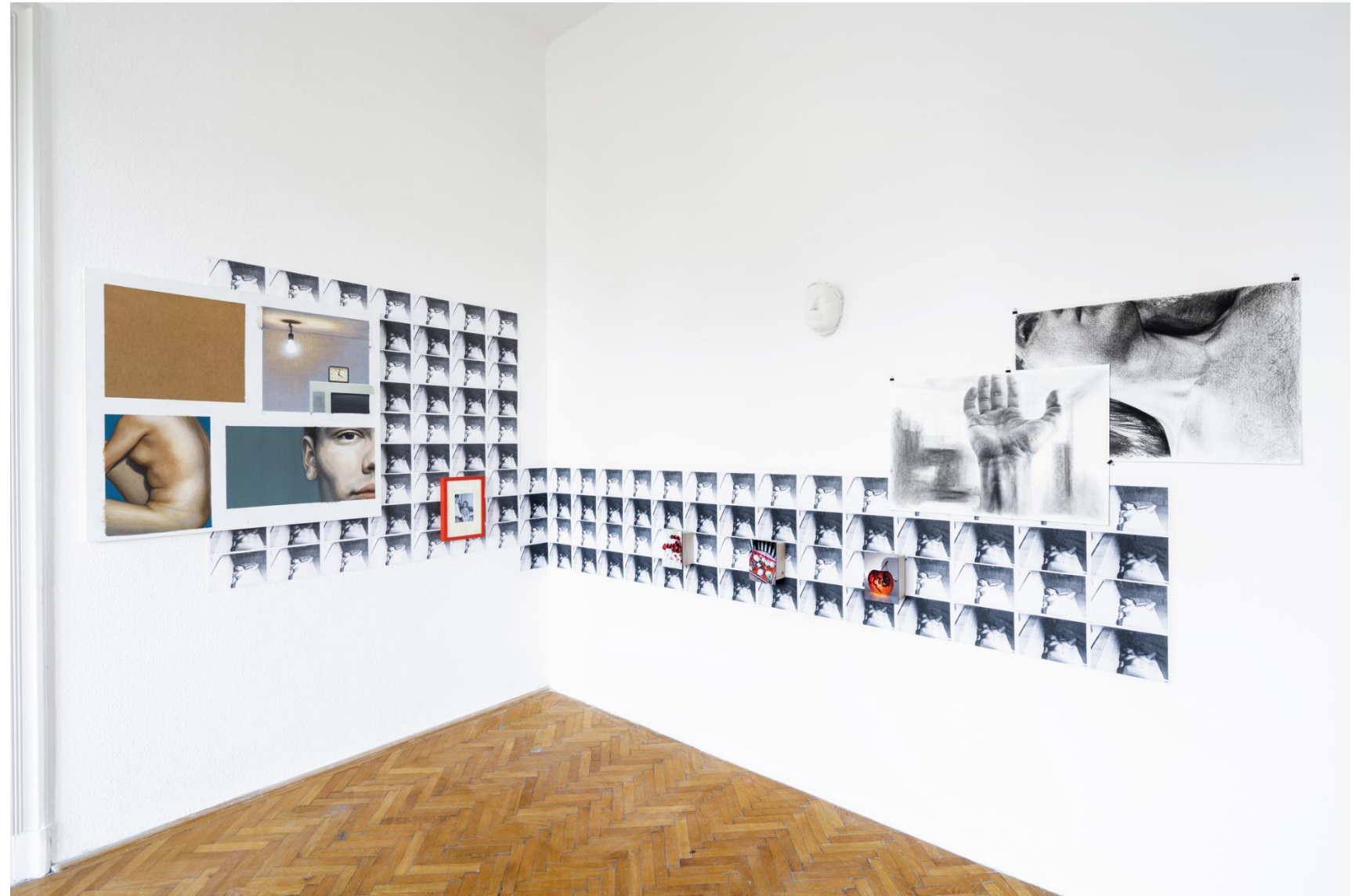
Oda-vissza, kívül és belül, 2022 installáció, vegyes technika (festmény, fotó, szénrajz, fénymásolat, gipszmaszk, fa dobozok)