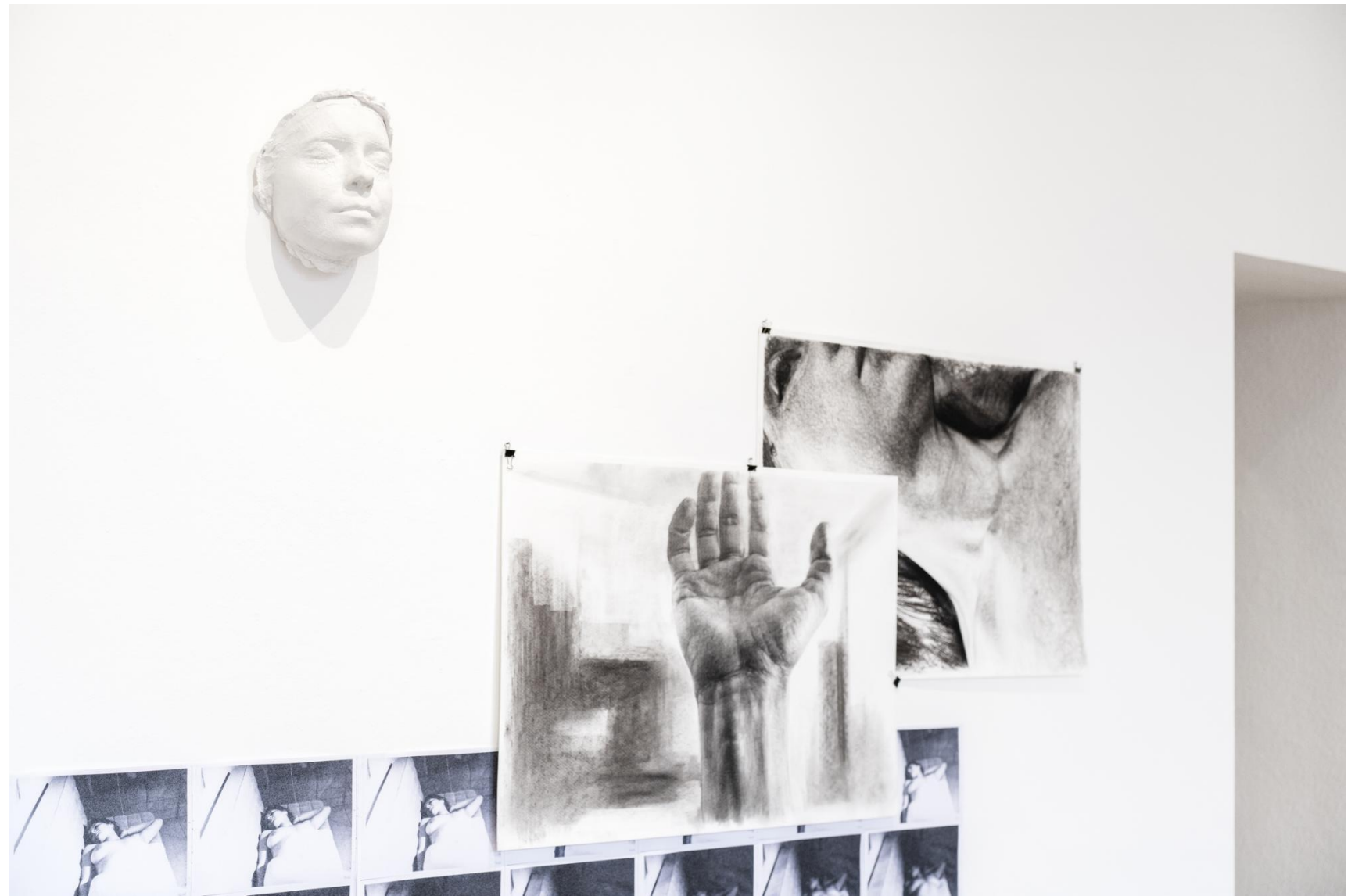
Kívül és belül, 2022 részlet