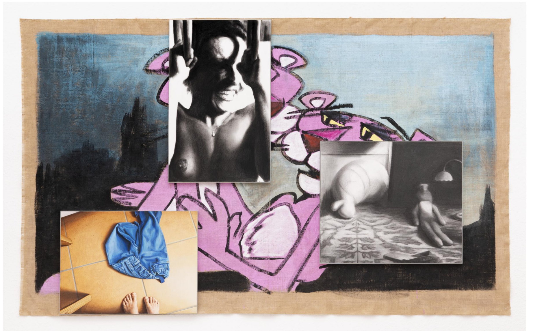
Első látásra rózsaszín, 2023

akril, szén, farost, vászon, 180 x 220 cm