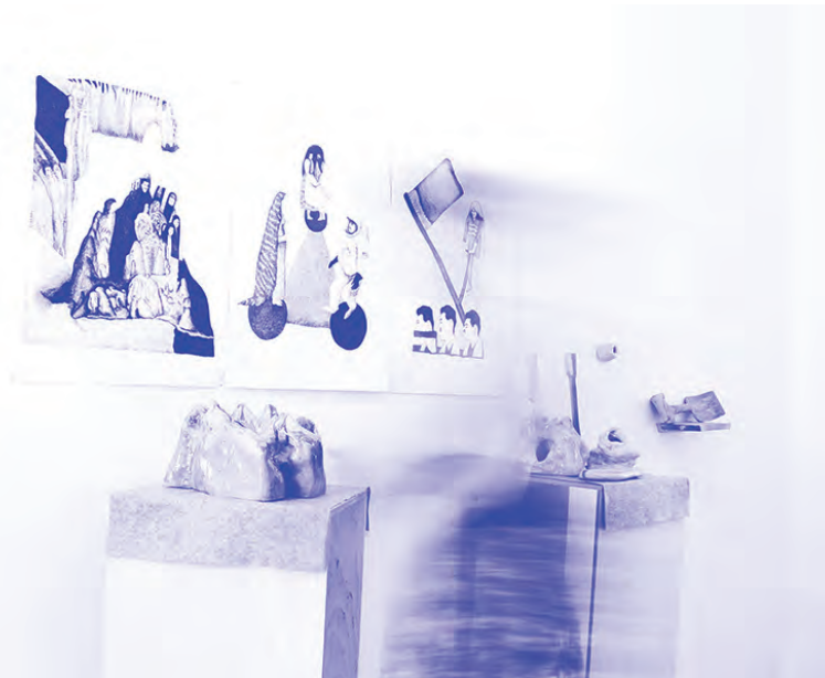
Melléktermék kiállítás, Bizonytalansági elv, 2018.

A Melléktermék gondolat régóta foglalkoztat, 2012-ben készültek a kiinduló rajzok és akvarellek a Melléktermék-sorozatban. Ezt a témát jelöltem meg a mestermunka alapjának. (Valamilyen formában, közösségi módon egy hatalmas, szemétből, hulladékból épített barlangrendszer is szerettem volna létrehozni, amely egy hód által összehordott gátra hasonlított volna.)