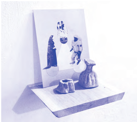
Szemző Zsófia: A töredezettségmentesítés egy örökkévalóság lesz, 2017, SZIKM

Majd 2 a Töredezettségmentesítés egy örökkévalóság lesz című kiállítás 2017 szeptemberében, a Smohay díj 3 kiállításaként Székesfehérváron Izinger Katalin kurátorral. 4 A mestermunka kiállítás-sorozat harmadik része 2018 júniusában valósult meg,