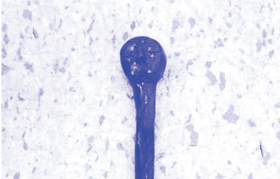
Delta Sleep, Fekete agyag, Mázás kerámia, 2017.