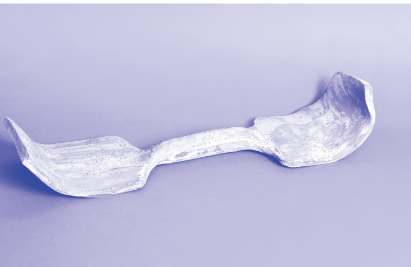
Javított tárgyak, 2017, A töredezettségmentesítés egy örökkévalóság lesz, SZIKM, Fotó: Halász Dániel

Az említett három kiállításon és két akción keresztül készítettem el, és mutattam be azokat a munkáimat, amelyeken a melléktermék gondolatával foglalkozva dolgoztam.