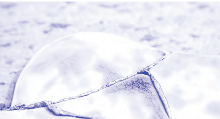
Ugyan abba a folyóba, 2019