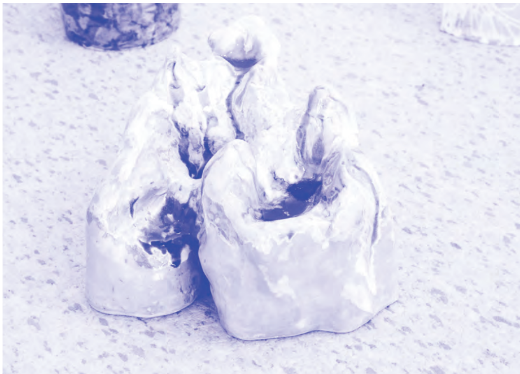
Athos, Etna, Hará Berezaiti, Ida, Kailash, Koya-San, Meru, Othyris, Olympus, Sinai, Taranaki... Mázás kerámia, 2017.

átértékelve, használhatatlan és felismerhetetlen tárgyakat készítettem. Formájuk nem enged funkciójukra következtetni. Szorosan kapcsolódnak ahhoz a Bizonytalansági elv kollázs és rajz- sorozat töredékekben megjelenő világához, amelyben egy ismeretlen kultúra töredékeiből áll össze az értelem, maga az emberi kultúra.