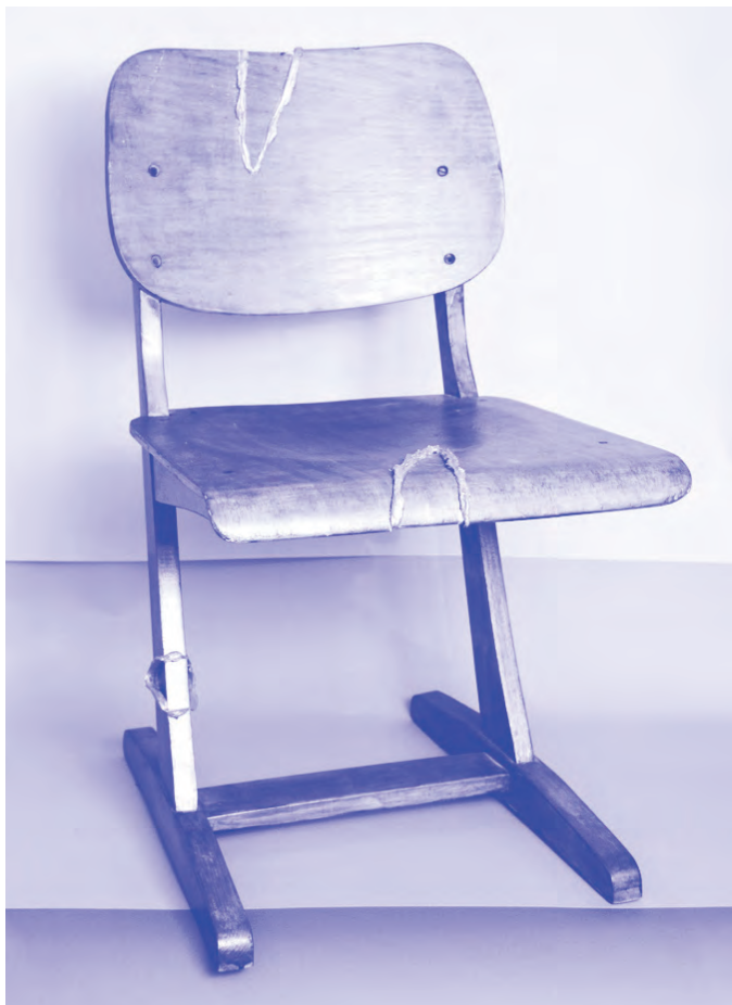
Javított tárgyak, 2017, A töredezettségmentesítés egy örökkévalóság lesz. SZIKM, Fotó: Halász Dániel

Elrontott szituációkat gyűjtöttem össze, és a szerencsés emberi döntéshelyzeteket is, mint például amikor valaki egy törött széket házilag javít meg és a törött láb helyett, gányolva egy botot helyez be, vagy valaki befűttes gumival javítja meg a nadrágsziccc elromlott cipzárját. Azt az ellentmondást szeretném bemutatni, ami az ember által elképzelt ideális megoldás és a megvalósult megoldás, továbbá ennek hatásai és mellékhatásai között feszül. A folyószabályozástól a hajszínezésig, a lakótelep koncepciójától az ortopéd cipők hatásán át, szétdarabolt szigeteken és változó országhatárokon át.