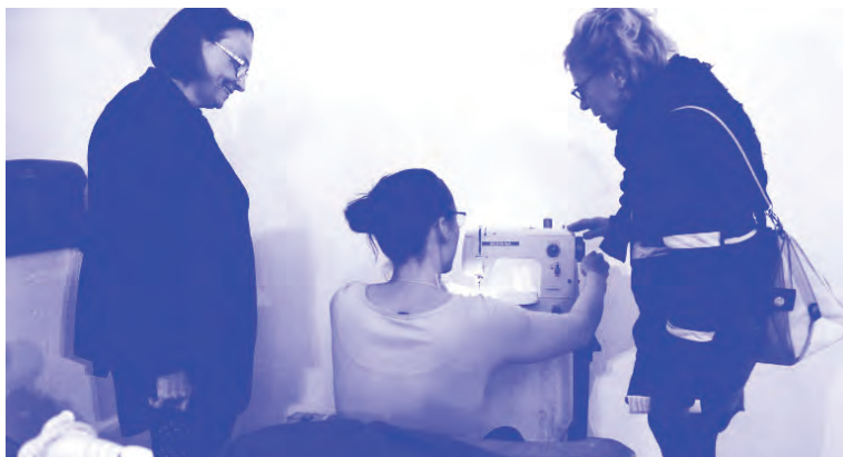
Javitóműhely, Székesfehérvár, SZIKM, 2017