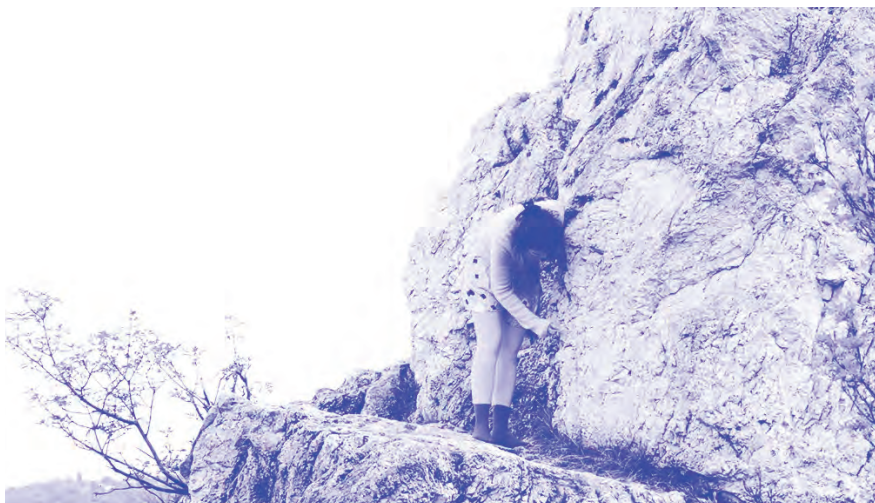
Rizikó videó sorozat, 2017, részlet

M egszakítok és újra felfedezek cselekvéseket. Alacsony sámliról próbálok tudatosan lezuhanni, de a testemben összerándulnak az izmok és a tudattalanom meggátolja a tudatos véletlent. Egy pohár vizet iszok le és iszok vissza, hogy mindig ugyanannyi maradjon. Fogkefével próbálok milliméterről milliméterre megtisztítani egy hegyet. Petpalackokból, szemétből eszkábálok egy tutajt, ami szabadidőmatracra hasonlít, ezen evickélek egy sekély vizű patakban. Visszamászok a fára, és eldobom a létrát, hogy ott maradhassak.