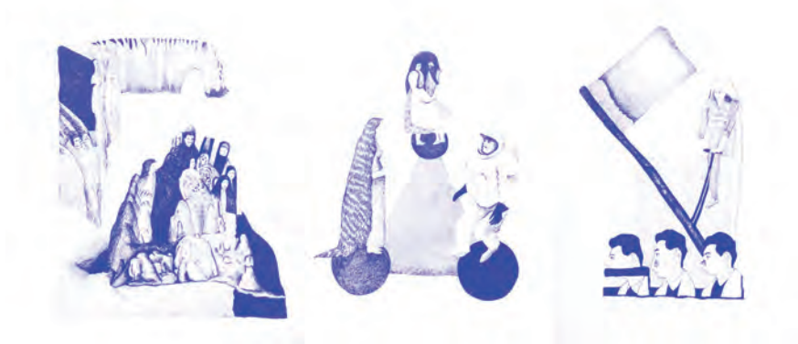
Rizikó videósorozat, 2018, részlet