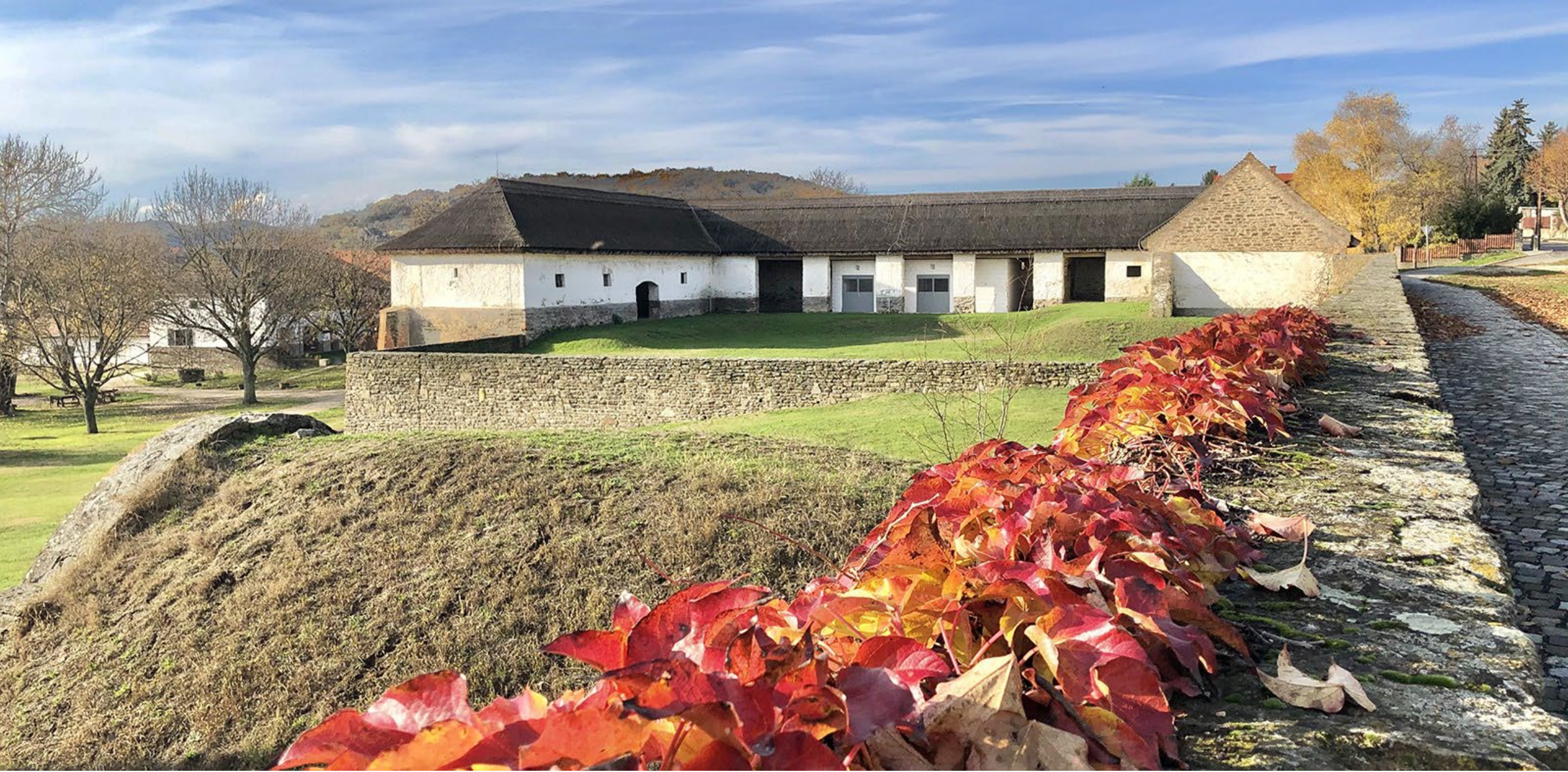
A tihanyi Somogyi József-művésztelep