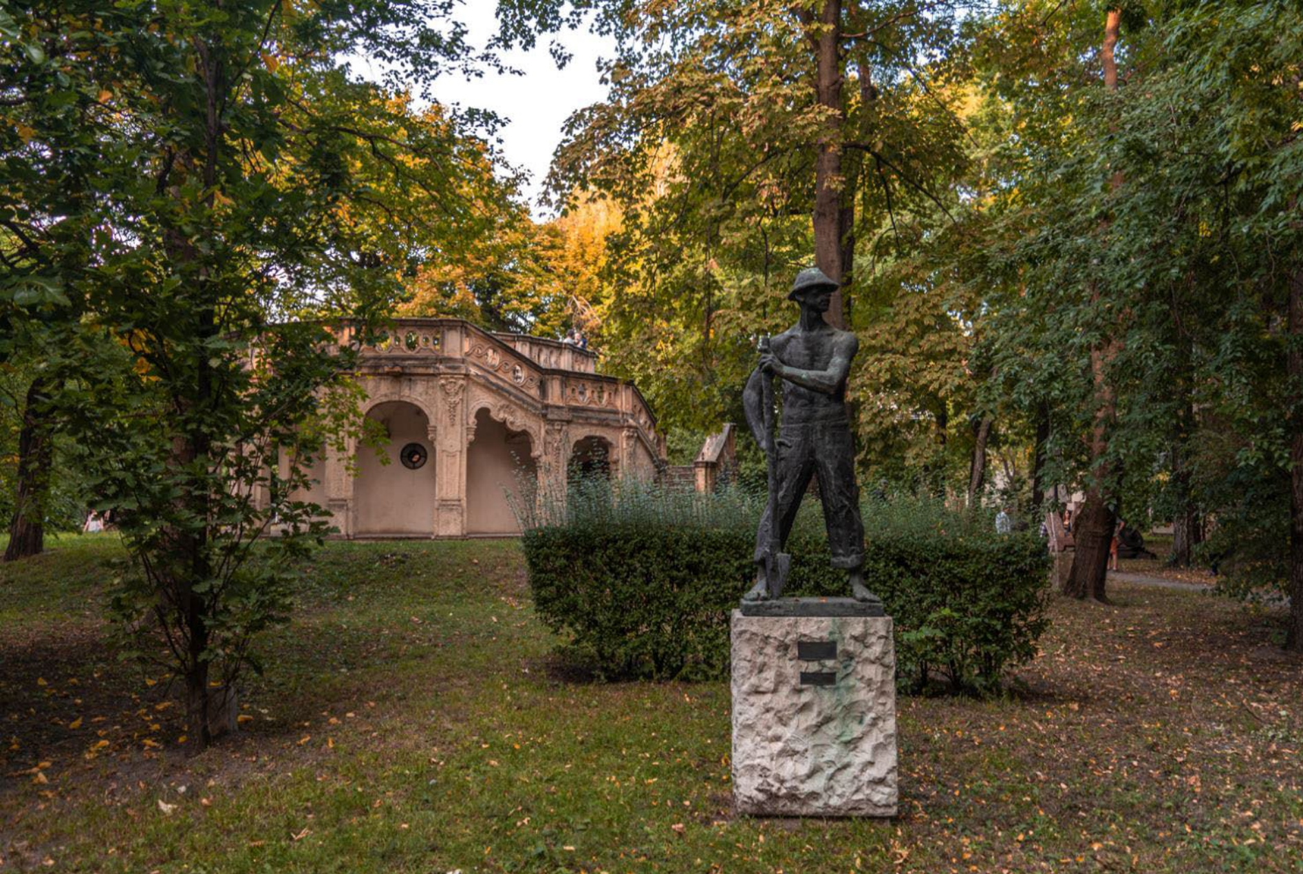
az Epreskert – Kmety György u. 26–28.