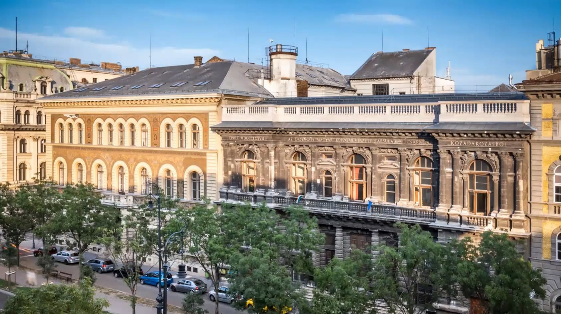
a Főépület – Andrassy út 69–71.