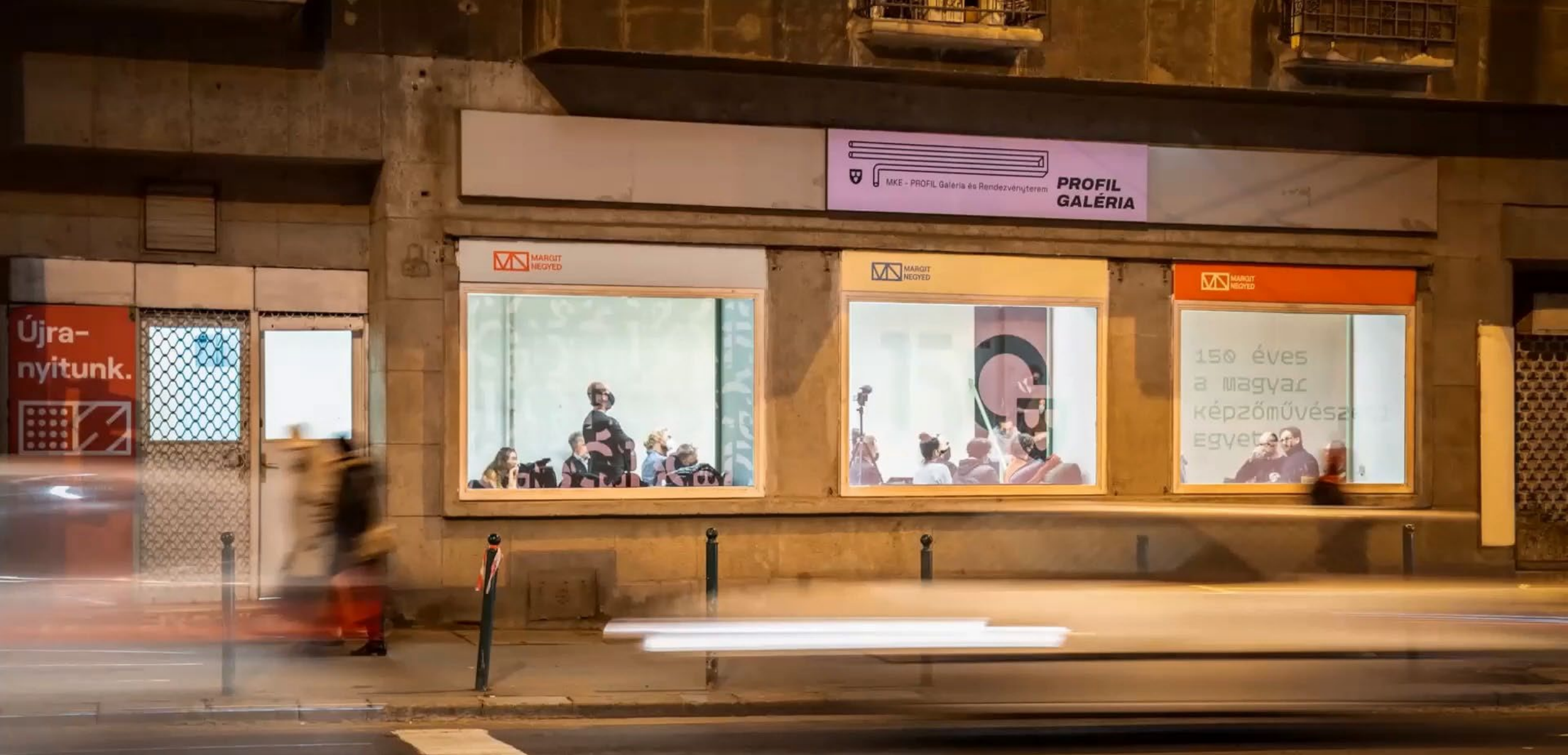
A Profil Galéria – Margit krt. 25/A