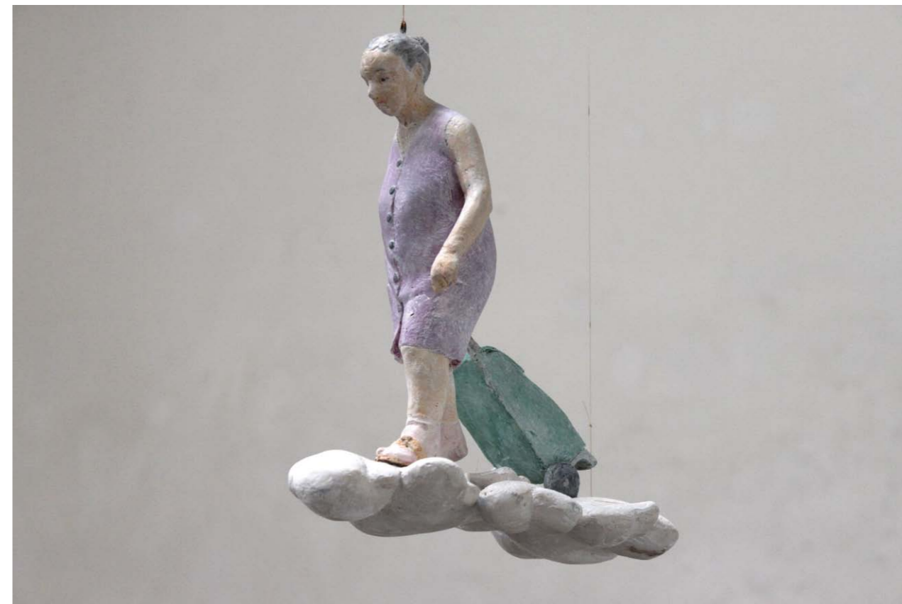
• Felhőjáró akril 24x12x24 cm 2013

Maradjunk annyiban, hogy Lukács István egy megátalkodott alak, többnyire csak akkor csinál szobrot, ha belső kényszere van rá, és már az, hogy évtizedek óta a magyar művészettörténet által figyelembe sem vett Gyulai művésztelepen dolgozik, jelzi azt, hogy Lukács Istvánra oda kell figyelni. Ha most nem lepett volna meg minket, akkor majd fog.