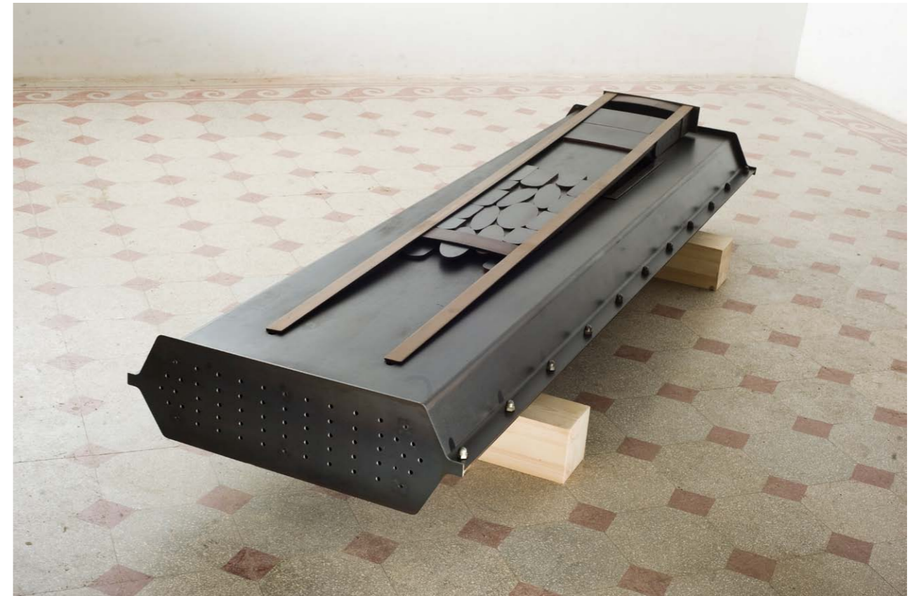
• Köz Test acél 37x250x79 cm 2013