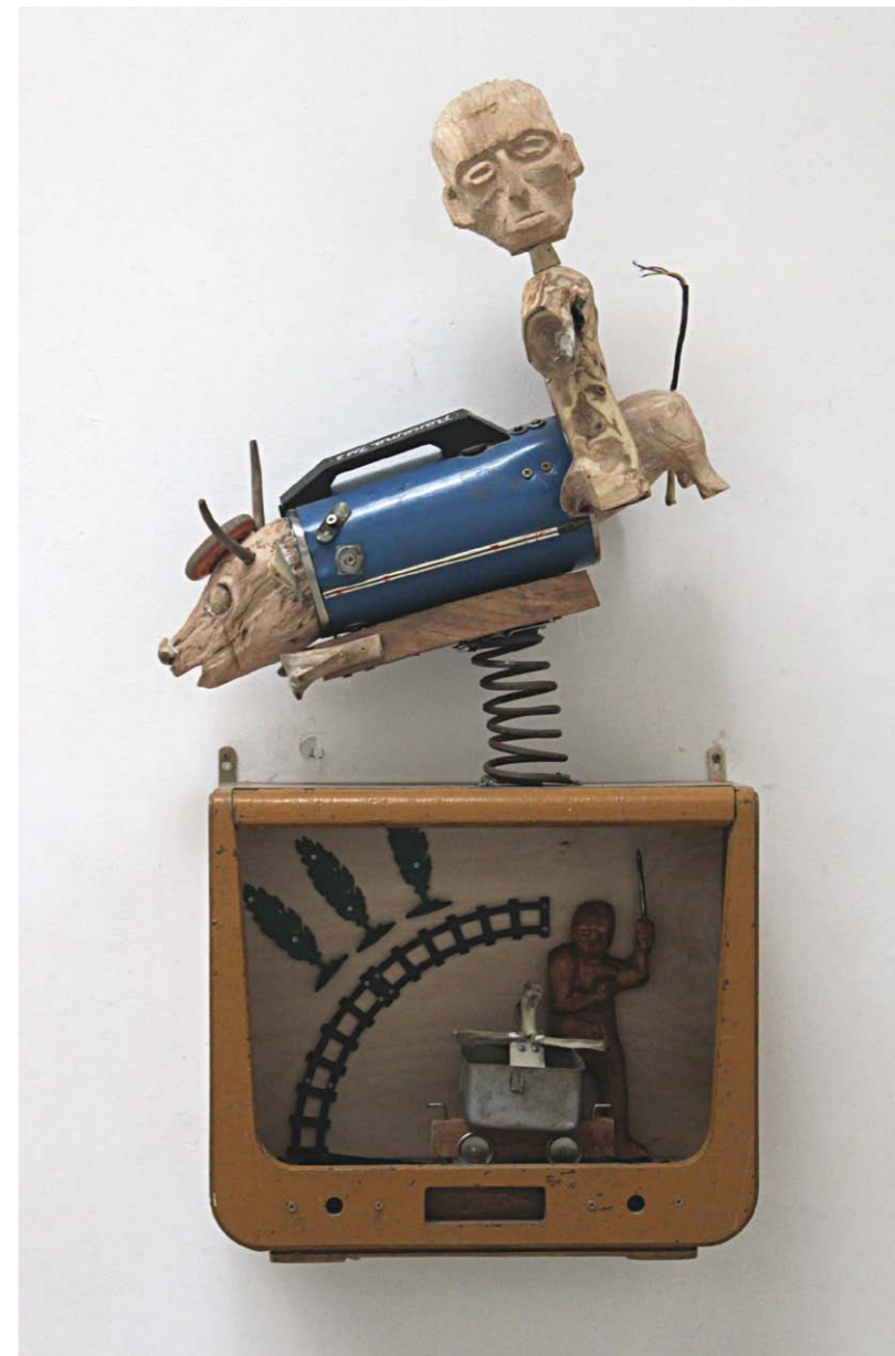
• Rodeó vegyes technika 134x66x35 cm 2013

Bogdándy nyers, szókimondó, sokszor brutális dobozplasztikáinak legfőbb értéke az, hogy nemcsak megdöbbentenek, de gondolkodásra is serkentenek.