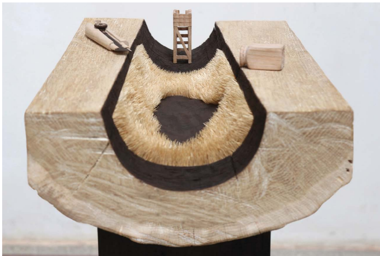
• Saját földön fa 25x40x60 cm 2013