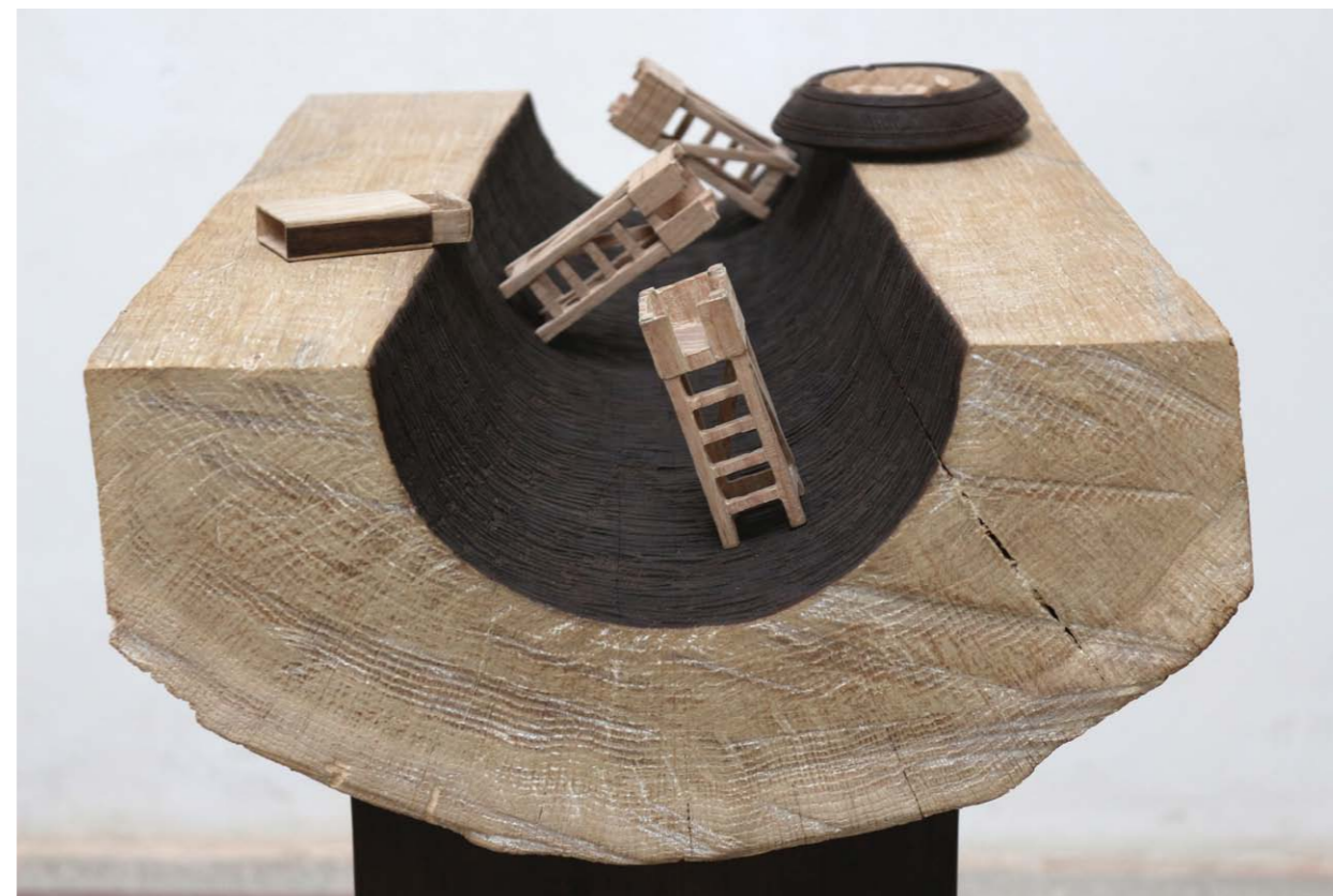
• Közös földön fa 25x40x60 cm 2013