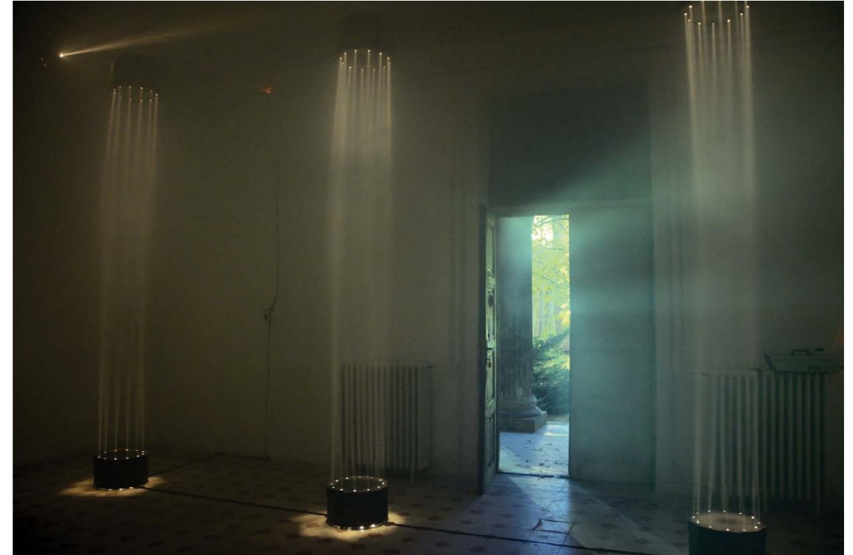
• Porticus 2.0 fény, füst, helyspecifikus installáció 2013