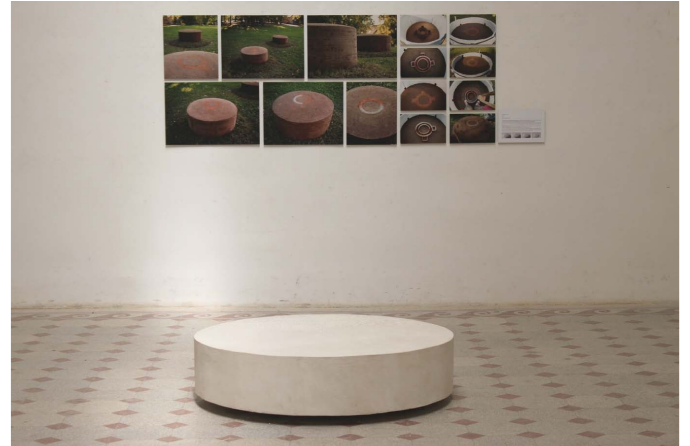
• Földkörök fotódokumentáció 2013 Áldozókő műkő 25x125x125 cm 2014