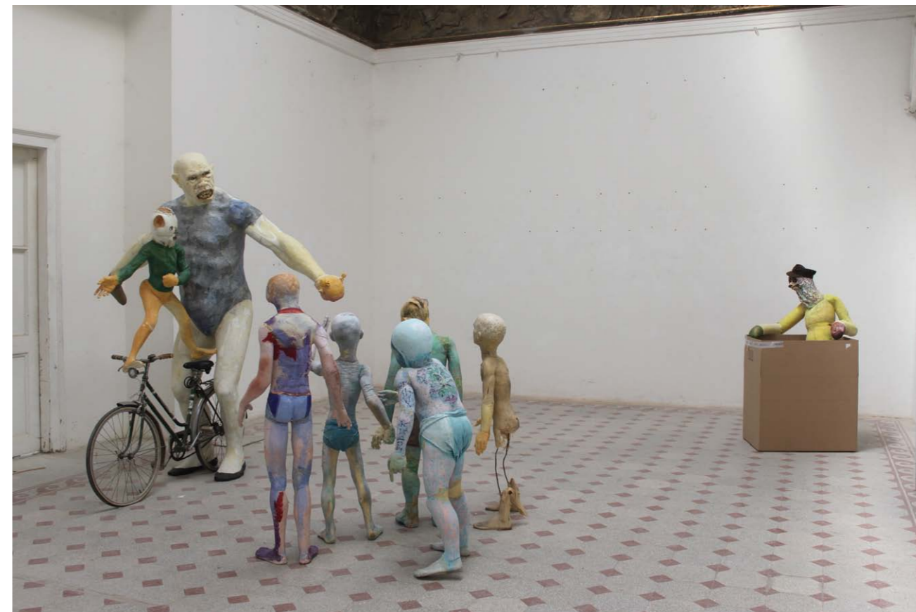
• Gentleman's Agreement vegyes technika változó méret 2014