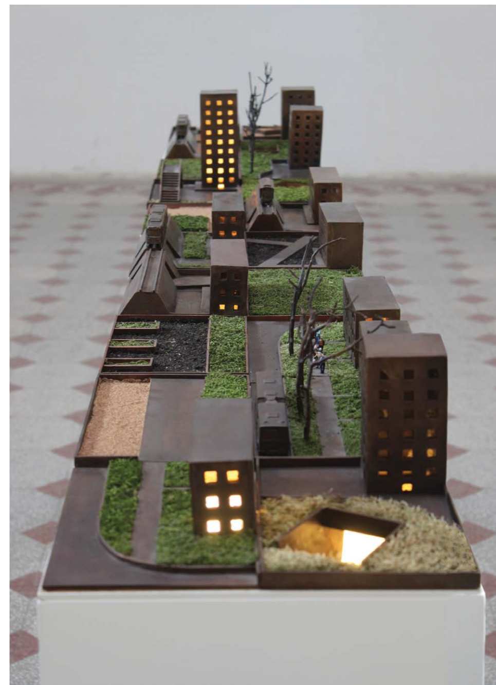
• Városcsopót bronz, homok, moha, föld, fém változó méret 2012-2014