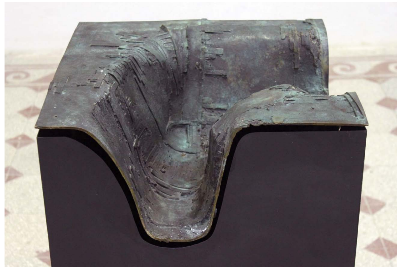
• Fiktív térkép/kanyon bronz, vas 90x50x50 cm 2012