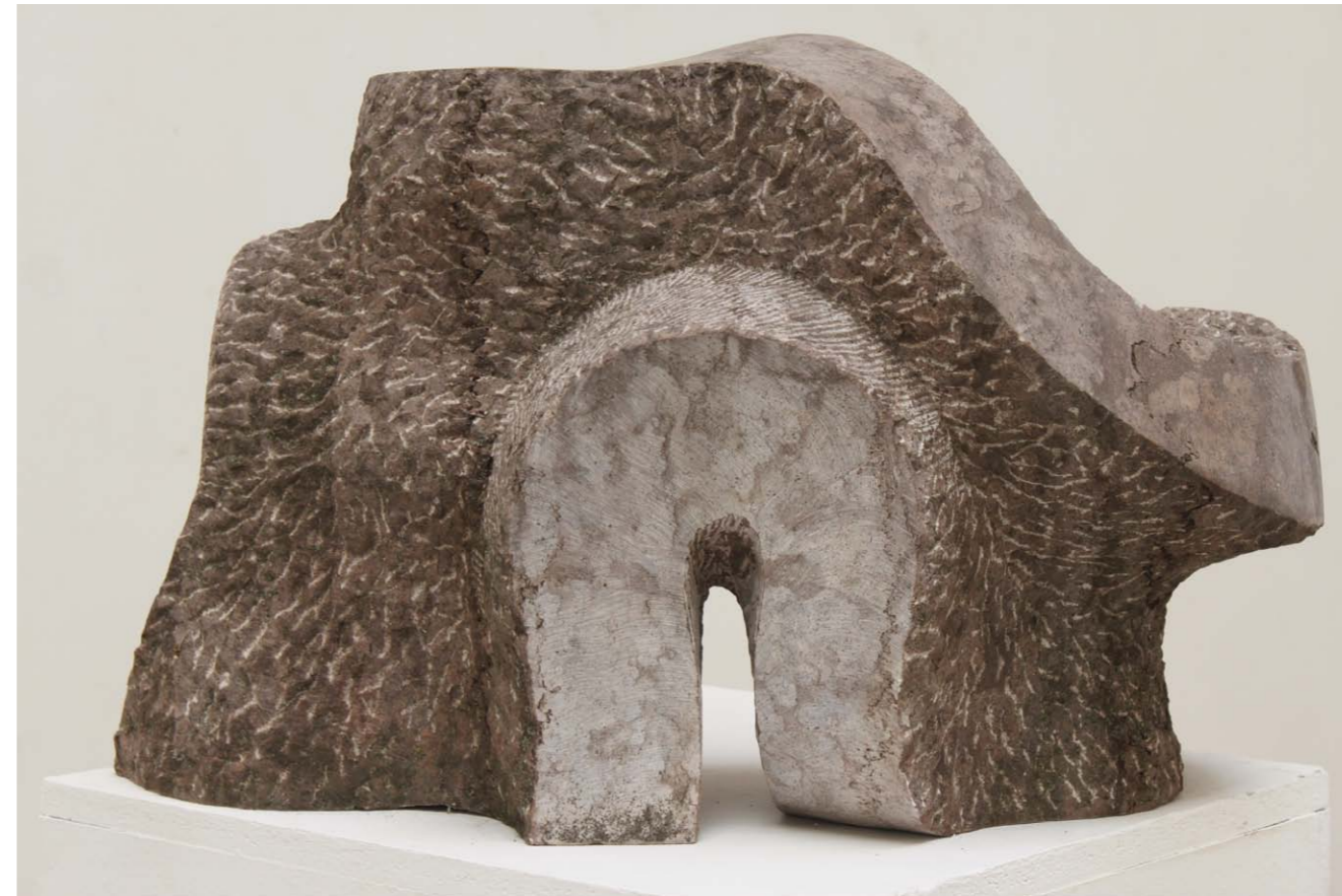
• Alul és felül vörösmárvány 40x58x37 cm 2008