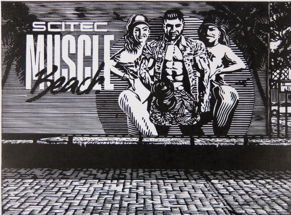
2. kép. Szabó Ábel: Biopolitika, linóleummetszet, 245x330 mm, 2021

Hitvallása szerint saját maga különböző identitások sokféleségét jeleníti meg. Maga az ORLAN név is erre utal. Megkülönbözteti művészetét a „body art”-tól, mert azt mondja, hogy esetében a szenvedés nem esztétikai tényező. Művészetét inkább „carnal art”-nak nevezi, ami a műtétek által folyton változó arc érzéki kifejezéseire utal. (forrás: https://www.artsy.net/article/artsy-editorial-70-body-modification-artist-orlan-reinventing ) Magyarországon 2021-ben a testátalakítás, illetve annak egyik típusa a politikai diskurzus központi témájává vált. Magának, a „biopolitikanak” művészetre gyakorolt hatását nem lehet vitatni. Arra számítok, hogy a biopolitikai anomáliák a közeljövőben számos műalkotás témáját fogják képezni.