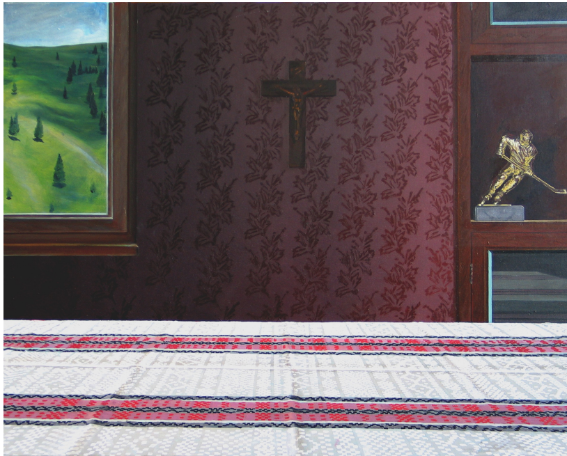
5. kép. Szabó Ábel: Csendélet, olaj-vászon, 80x120 cm, 2002

nyilvánvalóan vagy sikerül, vagy nem. Ezért a művészek folyamatosan „harcban” állnak az adott körülményekkel.