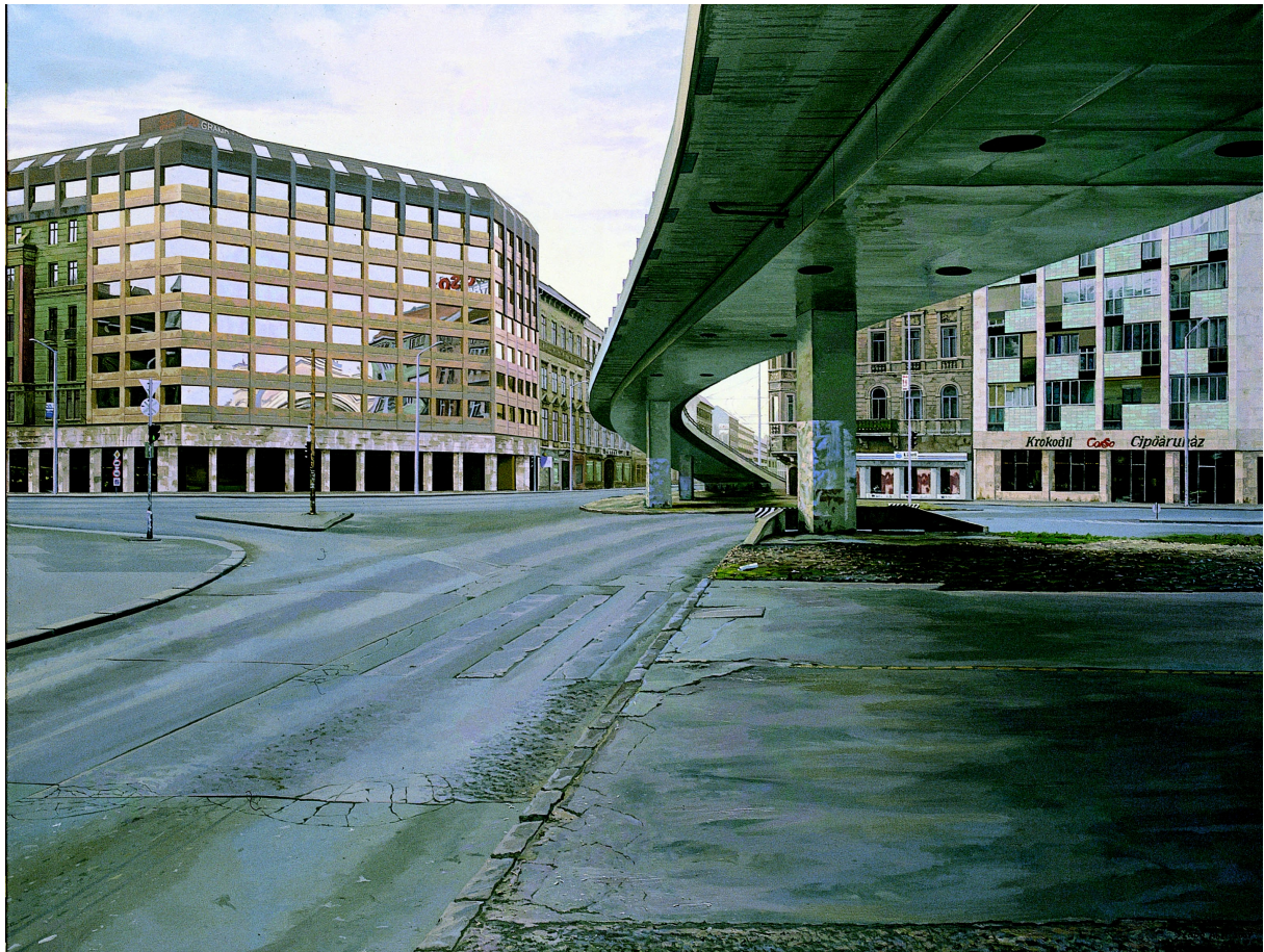
6. kép. Szabó Ábel: Baross tér, olaj-vászon, 150x200 cm, 2007

idején az üzenet megváltozásához nem feltétlenül szükséges hosszú időnek eltelnie. A saját vonatkozó képeim és a világvárvány között nincs másfél évtized. Nem arról van szó, hogy a jövő embere esetleg ne tudná, hogy eredetileg egy alkotás miért és milyen célból készült, hanem arról, hogy bele akarja látni saját korának kontextusát, és ebben a szándékában nem fogja őt megakadályozni alapos történelmi ismerete. Az egész tűnhet pusztán véletlennek, hiszen nem látjuk előre az eseményeket. Amikor már tudtuk, hogy Kínában tombol a járvány, akkor sem voltunk képesek elhinni, hogy néhány hónap után itt sem lesz az másképp. A dolgot érdemes megfordítani úgy, hogy lényegtelen a jelen igazsága a jóslatot illetően. Úgyis az utókor fogja eldönteni, hogy mit gondol igaznak a múltból. A munkák tartalmi megváltozása be fog következni. Ha nem egy járvány miatt, akkor valami más miatt. A változást nem lehet feltartóztatni. Tudomásul kell vennünk, hogy műveinket örökre „elveszítjük”.