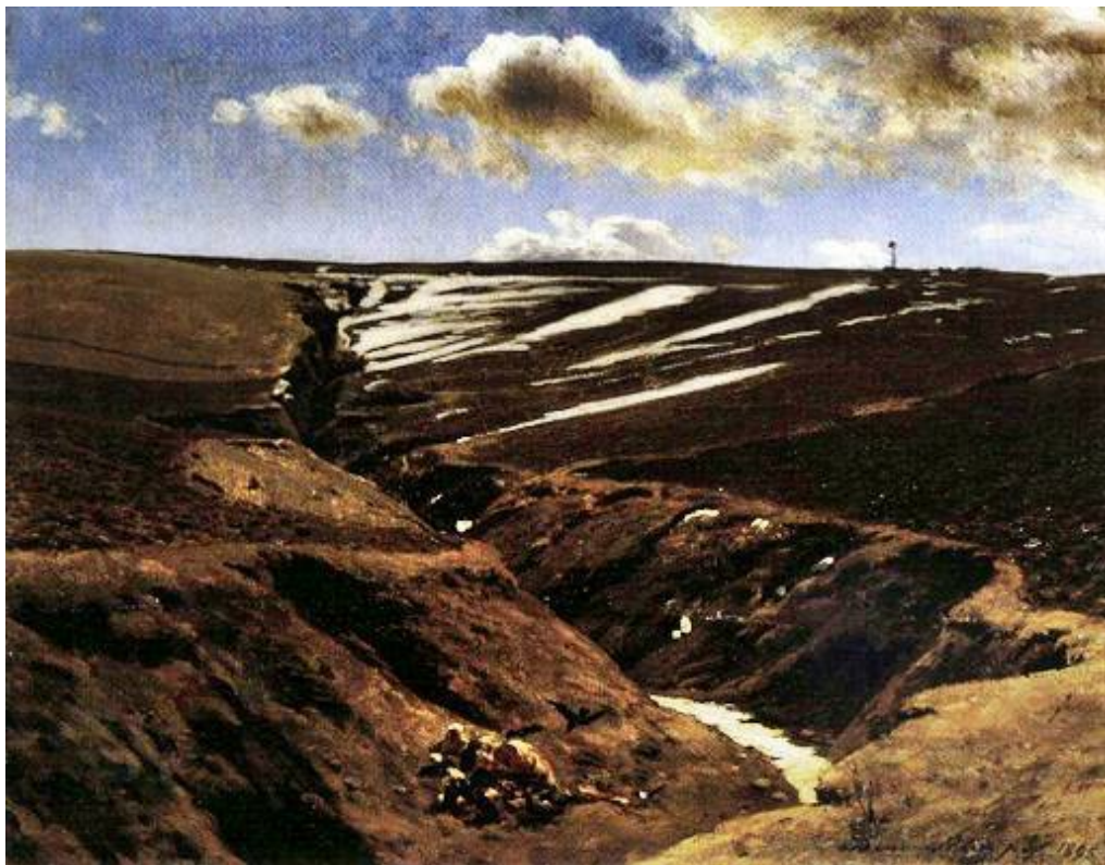
3. kép. Szinyei Merse Pál: Hóolvadás, olaj-vászon, 47,3x60,6 cm, 1884-1895 MNG

A fenti példák megmutatják, hogy Vermeer festészete hűen tükrözi korának történelmi és társadalmi viszonyait. Részei művészi témájának. Ezek a tények egy mai festőt, akit Vermeer művészete inspirál, figyelmen kívül hagynak. A motívumok teljesen mást jelentenek számára. Szabadon értelmezi a saját festői logikája szerint. Nem a történelmi háttér kutatása, hanem a festmény számára fenntartott üzenete az elsődleges. Tehát nem érti félre a művet. Nem egy korábbi helyzetet szeretne restaurálni. Az ő témája az élmény, ami közte és a korai mester műve közötti viszonyból származik.