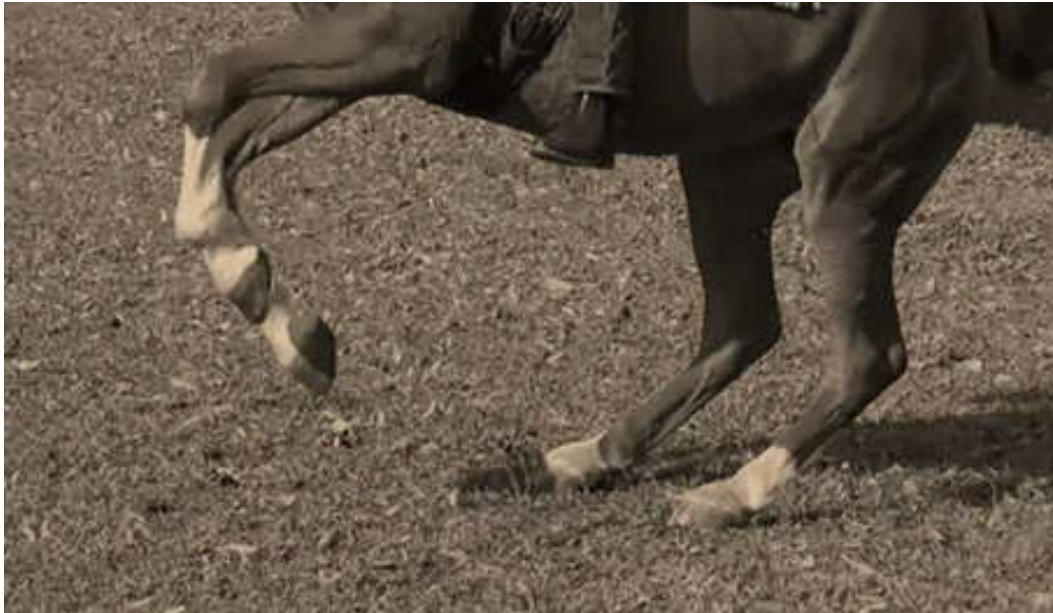
Veszely Beáta, Zita , 1,5 perces digitális videó, videó vetítés

köszönöm Góbyös István és lova közreműködését, valamint Solymosi István technikai segítségét az utómunkában.