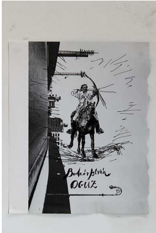
Veszely Beáta, Lélekzók , rajzsorozatból, talált újság lapok, fekete toll