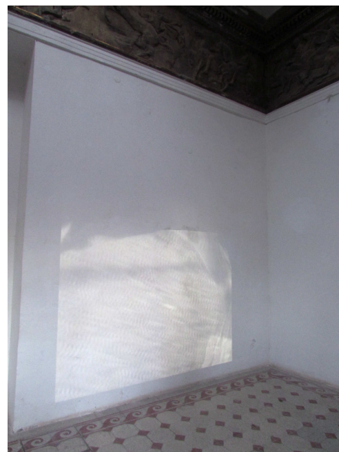
Veszely Beáta, Zita , 1,5 perces digitális videó, videó vetítés, fotó: Szabó Ádám és Veszely Beáta