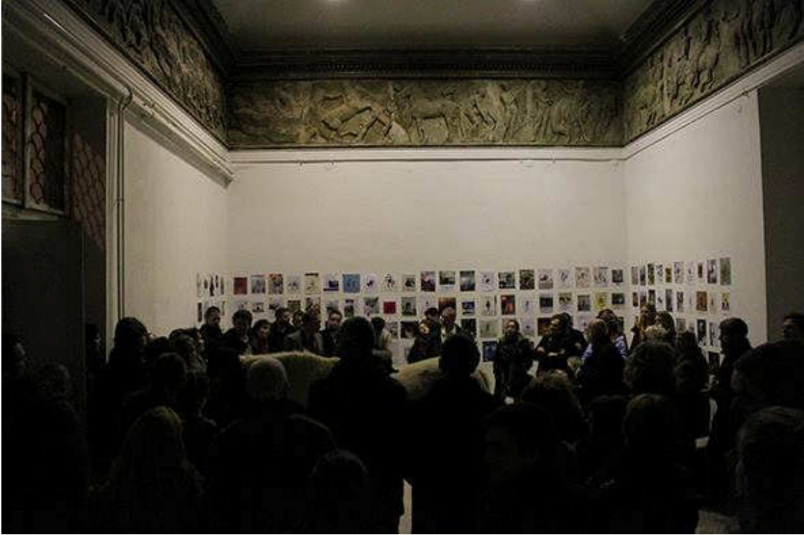
Veszely Beáta, Lélekzók , 2016 (önálló kiállítás és mestermunka, Parthenón-fríz terem, Budapest)

A kiállító teremben munkám négy részből, négy műből állt.